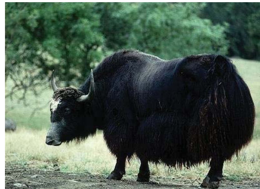
GIỐNG BÒ YAK CỦA TÂY TẠNG

Quê ông ở tỉnh Kham , thuộc miền đông Tây Tạng. Ông được chọn lựa cùng với vài người khác nhờ vóc dáng cao lớn và lực lưỡng. Những người có vóc cao hơn hai mét thường được tuyển làm người bảo vệ trong các tu viện. Họ mặc những chiếc áo dài có độn vai rất cao để trông có vẻ to lớn, lấy lọ bôi mặt để cho có vẻ hung tợn, và sử dụng những cây gậy to, dài để trừng phạt những kẻ xấu.